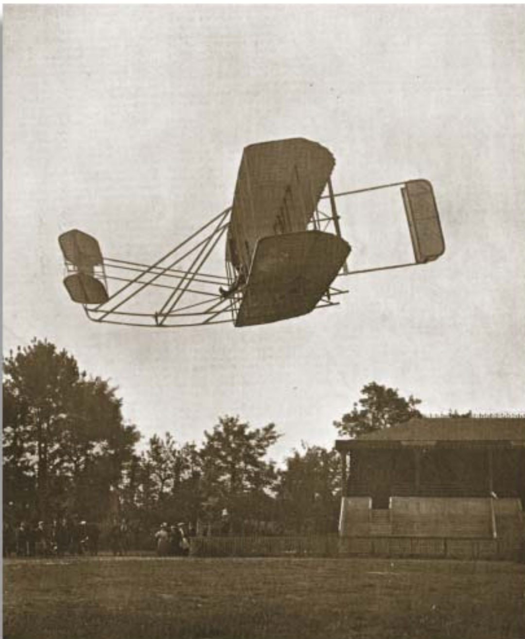
Letadlo bratrů Wrightových je poprvé veřejně představeno. Starší z bratrů Wilbur s letounem Model A předvedl 8. srpna 1908, jak velký náskok mají Wrightové před všemi svými soupeři.

funkčního letadla je „vyvažování a řízení stroje ve fázi vlastního letu.“ Wrightové se proto soustředili na hledání té pravé metody ovládní letadla. Vyvinuli ovládní letadla okolo tří os a tím zavedli principy, které se používají dodnes. Uvědomovali si, že stejně jako se cyklista musí naučit jezdit na kole, tak i pilot se bude muset naučit ovládat letadlo.