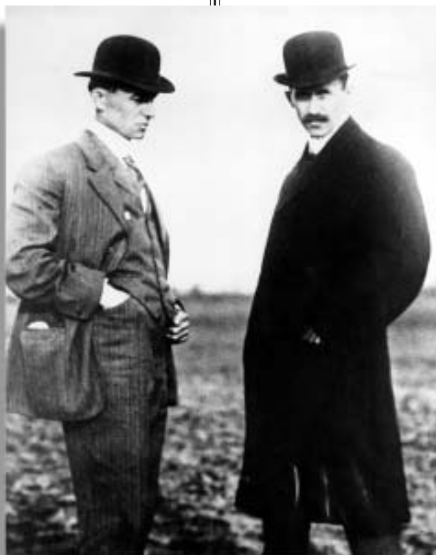
Wilbur (vlevo) a Orville Wrightovi, tiskaři, výrobci jízdních kol, vynálezci motorového letadla.

Orville Wright vzletl 17. prosince 1903 v prvním motorovém letadle, uletěl s ním 39 metrů a po 12 vteřinách přistál do písku. Dnes toto datum považujeme za významný milník v historii letectví, ale v případě tohoto konkrétního letu nelze souhlasit s tvrzením, že Wrightové dosáhli nějak převratného úspěchu oproti jiným vynálezům své doby, kteří provedli i delší lety – jen tvrdě přistáli.