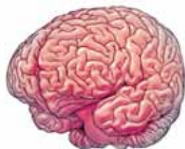
Mozek člověka 1 350 gramů