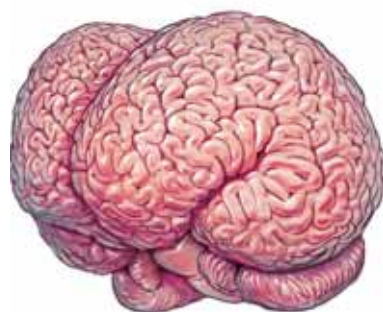
Mozek kosatky dravé 5 620 gramů

Zvířata také často vykazují sociální chování společně s lidmi. Zkušební mravenci učí mladé tak, že je vodí ke zdrojům důležité potraviny. Surikaty zase vyučují svá mláďata umění bezpečně roztrhat a sníst smrtelně jedovaté leč chutné škorpióny. A řada studií prokázala, že různé druhy zvířat, jako například psi domácí, malpy kapucínské a šimpanzi protestují proti nerovnoměrnému rozdělování potraviny a vykazují tak to, co ekonomové nazývají „averte vůči nespravedlnosti“. A co víc, četné důkazy nám potvrzují, že zvířata nejsou jen uzavřena ve svých každodenních rutinách udržování dominantního postavení, péče o mláďata a hledání nových partnerů ke spáření nebo pro vytváření společných koalic. Naopak, dokáží pohotově reagovat na nové sociální situace – například když si podří-